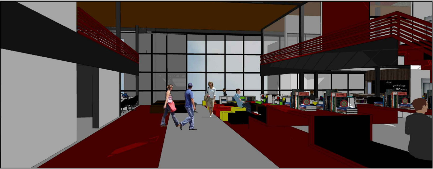
Observador do térreo para o segundo pavimento - vazio possibilitando a integração visual