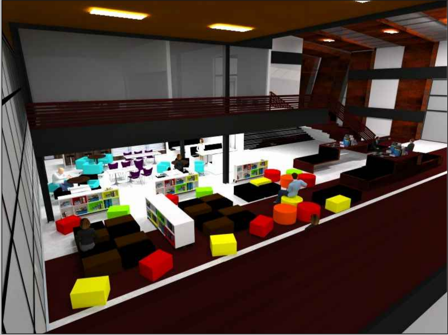
Perspectiva de cima do mezanino do atelier- integração visual

Manter o VAZIO NA ÁREA CENTRAL DO PROJETO tem por finalidade continuar com a integração ainda que não física, mas sim visual, para permitir que se conheça as atividades dentro do Centro Cultural.